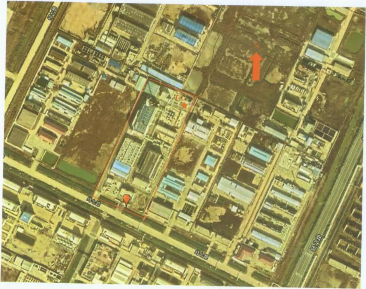
图 1 废水★监测点位图